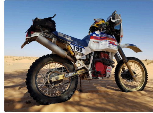
la N° 180 en état