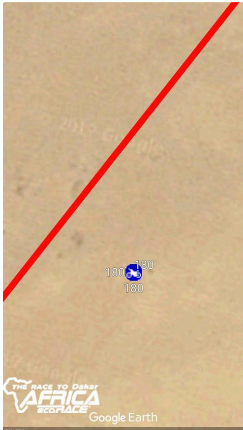
la N° 180 sur google earth