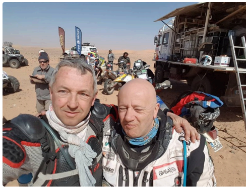
une franche amitié