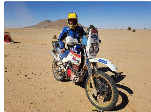
le pilote et sa monture