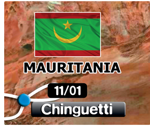
l'étape 9 pour jeudi 11 janvier