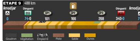
détail de l'étape du jeudi 11 janvier