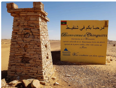
une belle vue de Chinguetti