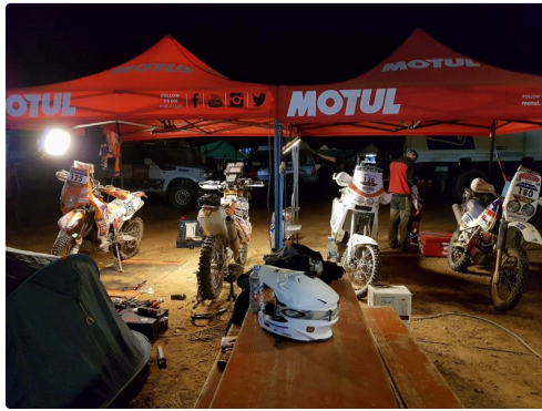
le repos pour les machines