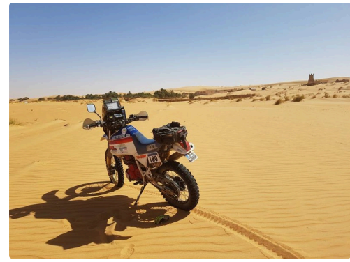
le pilote absent mais il faut bien que quelqu'un prenne la photo