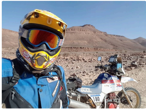
le pilote et sa monture