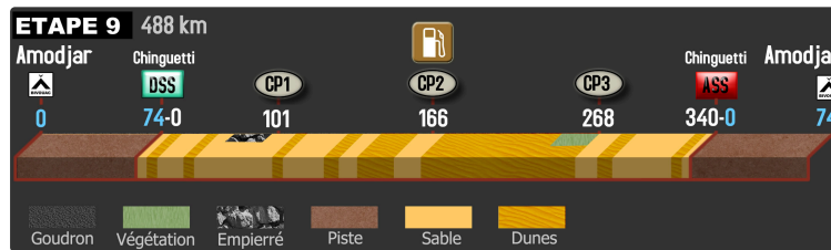
Africa eco race 2018 : étape 9 du jeudi 11 janvier

Bertrand Besse nous fait partager des moments de sport et de culture