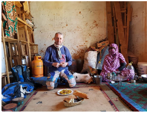
le motard intégré