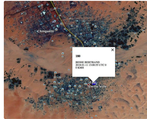
un moment de la course