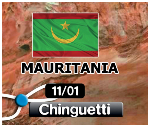
la boucle de Chinguetti