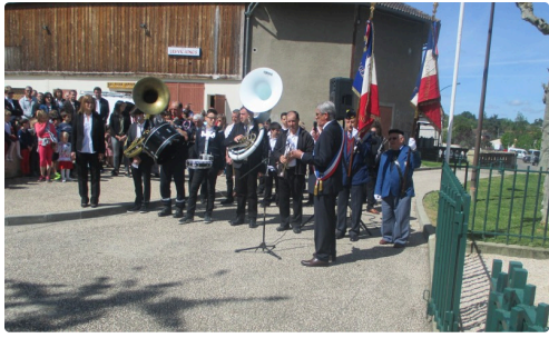
L'harmonie vicoise présente dans toutes les cérémonies