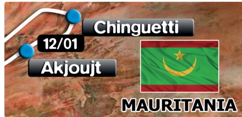
l'étape du jour