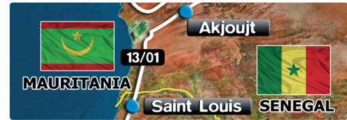
l'étape du samedi