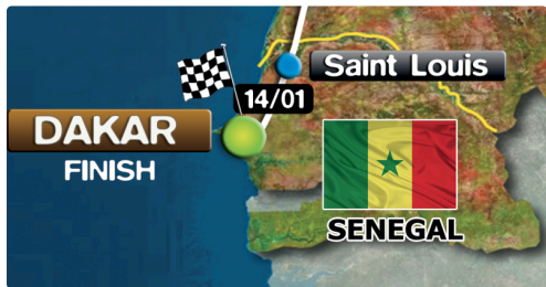
l'étape finale au lac rose