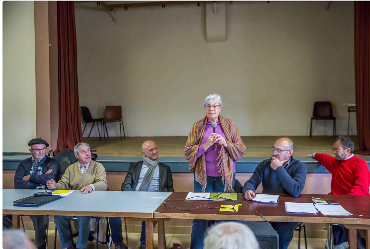
Caupenne-d'Armagnac – Réagir à la bourde énorme de la MSA

L'Aicra ne comprend pas la manière dont elle est corrigée