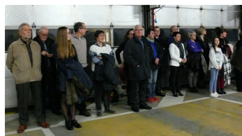
Les maires d'Auch, Lahitte, Montaut les Créneaux, Ordan-Larroque, Preignan, Castin, Duran et Tourrenquets étaient présents à la cérémonie.