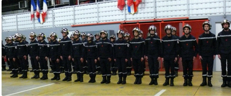
Ce sont 2 678 interventions qui ont été effectuées par le Centre de secours d'Auch

Samedi 20 janvier à 18 h 30 au Centre d'incendie et de secours d'Auch s'est déroulée la traditionnelle cérémonie de la Sainte Barbe. Outre les diverses personnalités politiques, militaires et civiles, étaient aussi présents les maires des communes défendues par le Centre de secours d'Auch (Auch, Lahitte, Montaut les Créneaux, Ordan-Larroque, Preignan, Castin, Duran, Tourrenquets).