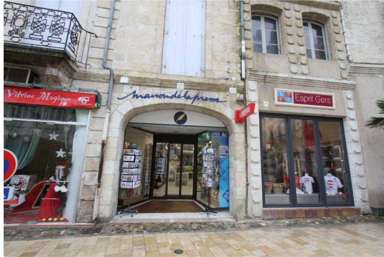
La maison de la presse en bonne place

La maison de la Presse passe de la rue Gambetta à la place St Pierre.