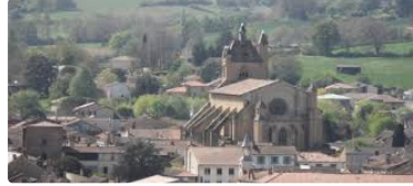
Les travaux du clocher vont bon train !