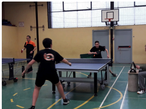
photo d'un jeune de l'équipe 5

Prochaine journée de championnat dans 15 jours. Toutes les équipes évolueront dans la salle polyvalente. Samedi 27 janvier critérium individuel à Auch.