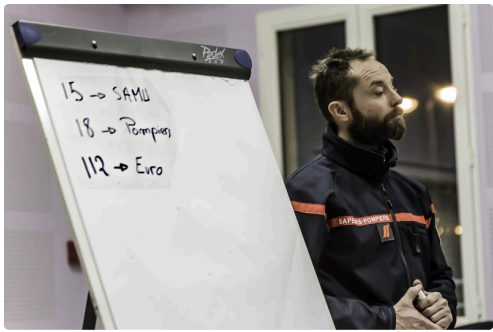
Révision des numéros d'alerte