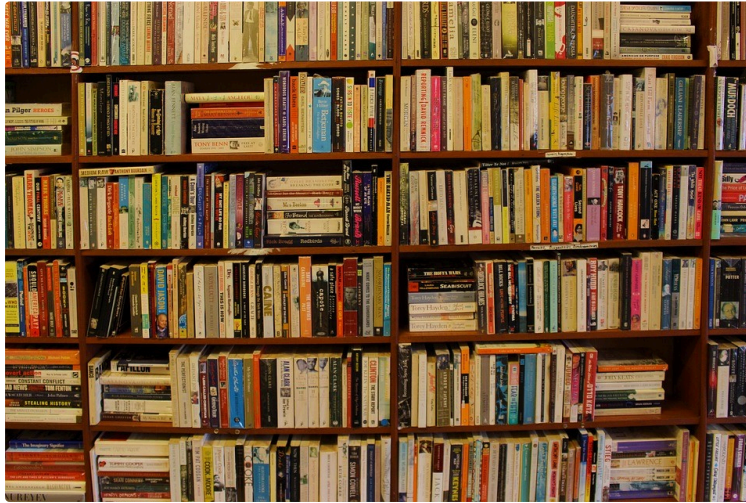
A vos marque-pages !

Chaque premier samedi du mois, le Journal du Gers vous propose une balade chez les libraires et vous révèle leurs coups de cœur du moment.