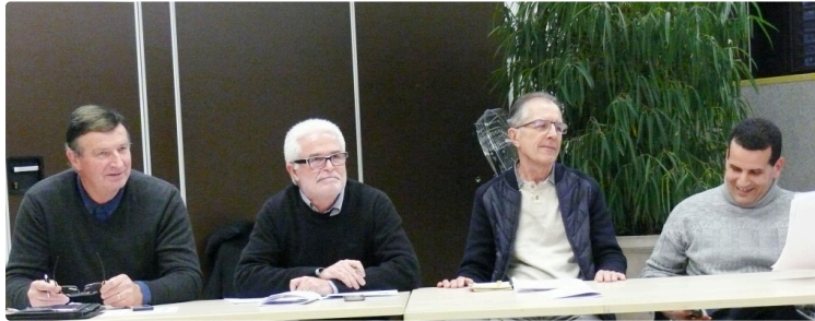
Le Comité départemental handisport a tenu son assemblée générale

Une structure qui organisera en 2018 quatre compétitions de niveau national