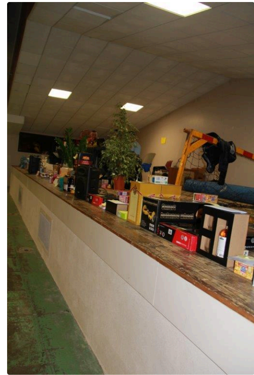
le panel des lots