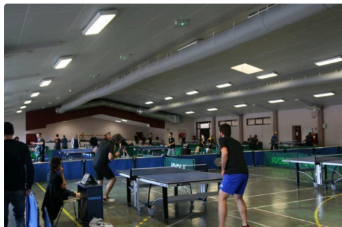
12 tables à la polyvalente pour 6 équipes

Prochaine journée le 17 février, où le club recevra encore dans la polyvalente à partir de 13h30.