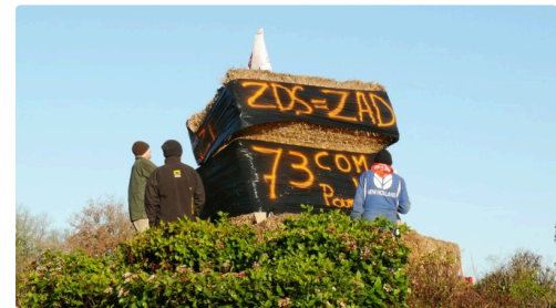
Mise en place des banderoles.