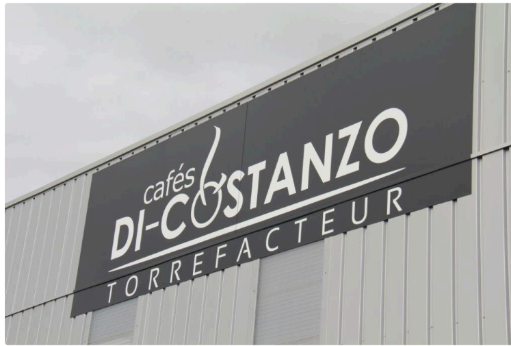
Les Cafés Di-Costanzo à l'honneur

A la suite de la parution du classement de la croissance des 500 entreprises les plus dynamiques au plan national, dans les Echos du 10 février 2018, pour la brillante entreprise gersoise "les Cafés Di-Costanzo", dirigée par les époux Gavanier, nous avons été reçus ce jeudi 15 février, par Emilie Gavanier.