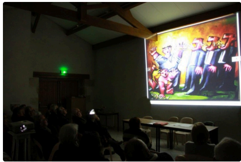
Présentation des artistes 2018.