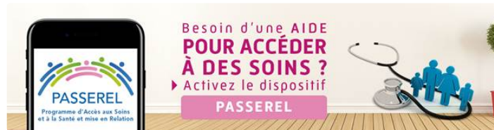
Faciliter l'accès à la santé et lutter contre l'exclusion:

les missions prioritaires de l'Assurance Maladie