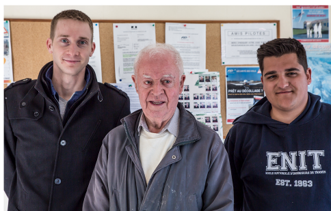
Nogaro – Aéro-club : effort sur les jeunes; l'aérodrome rebaptisé