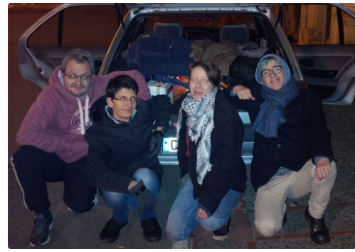
tournage à la maison Claude Augé