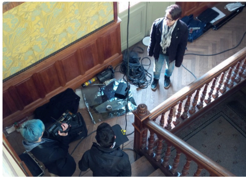
tournage à la maison Claude Augé