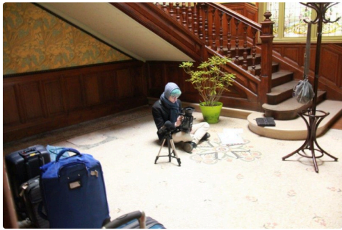
tournage à la maison Claude Augé