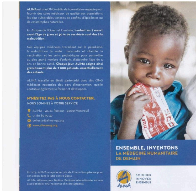
CONCERT au profit de l'ONG : ALIMA