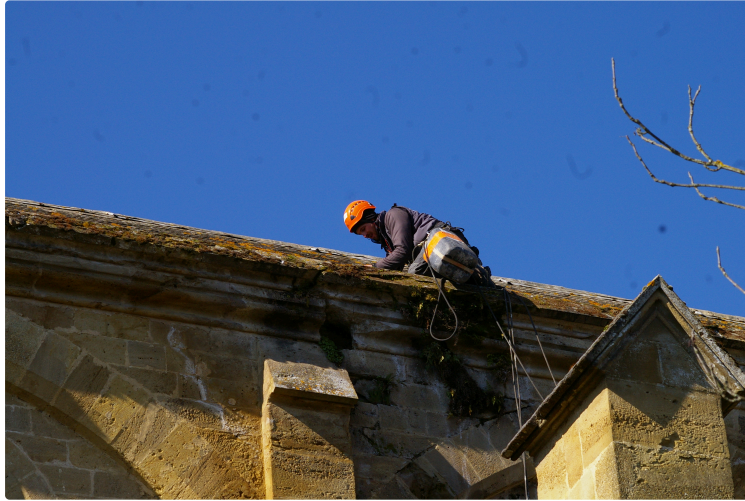
Dévegetalisation de l'église

Trois jeunes "cascadeurs" d'une entreprise Bigourdane spécialisée dans les travaux d'édifices travaillent sur le toit de l'église de Plaisance.