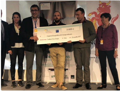
le 2nd prix de la fondation Pierre Sarazin