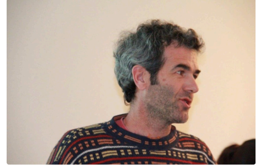
pour le Cesbio Jean-François Dejoux