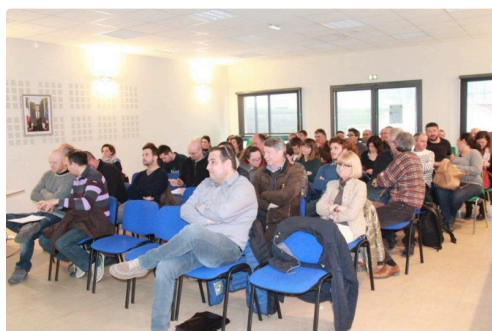
une soixantaine de personnes à l'écoute