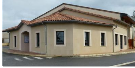
Groupement des Agriculteurs de la Gascogne Toulousaine

C'est ce lundi 5 mars qu'à eu lieu l'assemblée générale annuelle du Groupement des Agriculteurs de la Gascogne Toulousaine .