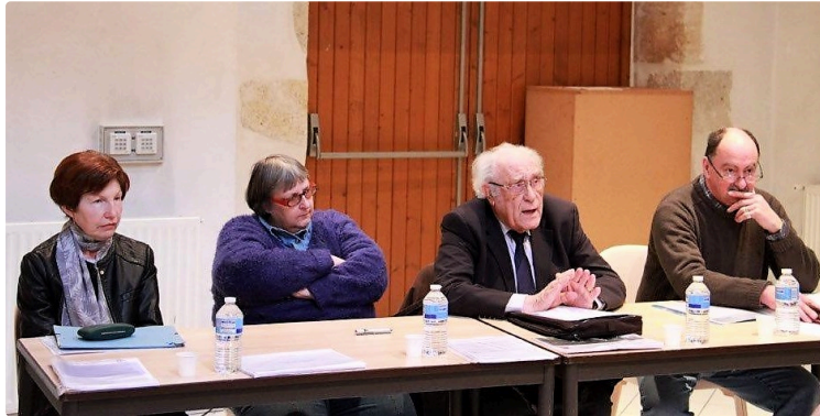
A.G du 8 mars 2018 des Amis des Promenades

Au cours de leur assemblée générale le 8 mars 2018, les Amis des Promenades de Condom ont analysé les trois documents officiels à leur disposition concernant la rénovation des Promenades et les finances de la commune : le projet en lui-même (voté par le conseil municipal le 23 décembre 2017), le rapport phytosanitaire réalisé par l'ONF (Office national des forêts) au cours de l'été 2017 et le rapport de la chambre régionale des comptes effectué sur les gestions 2009-2015.