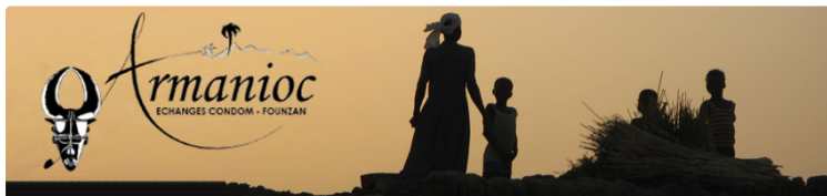
Armanioc : Après d'intenses activités en France et au Burkina-Faso l'association se met en sommeil