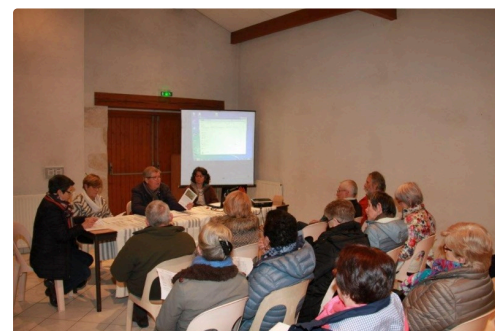
Une vingtaine d'adhérents ont assisté à l'assemblée générale.