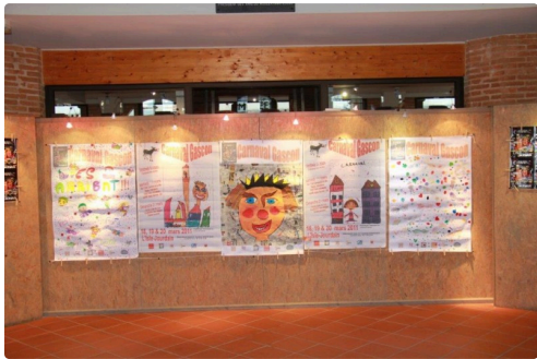
carnaval gascon, la festività de ce long week-end chez les lislòis