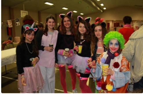
des jeunes filles pour la photo