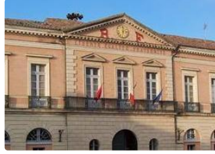
Table ronde développement économique de la Gascogne Toulousaine

29 mars 2018 en la salle des mariages de la mairie lisloise