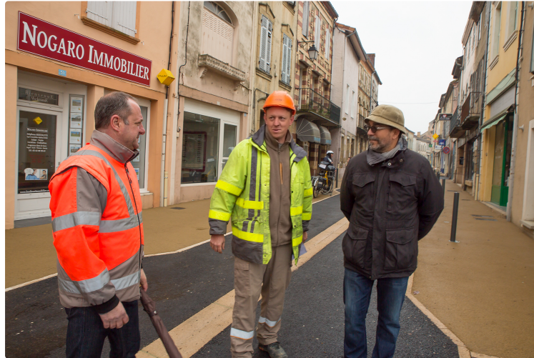
Fin du chantier rue de la République (ex-rue Nationale)