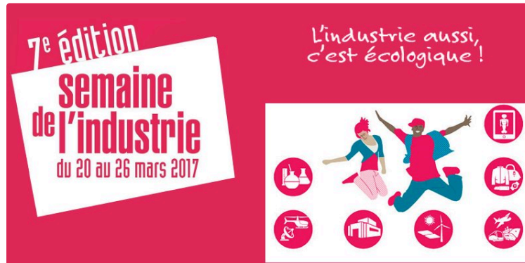
la semaine de l'industrie

Une semaine pour tout savoir sur les métiers & formations de l'Industrie.