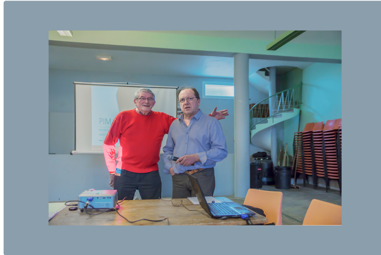
Perchède - Création de Pimao pour « Mieux vivre dans ce monde qui change »

Au service de l'intérêt général dans le Bas-Armagnac