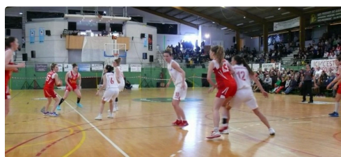
Phase de jeu.