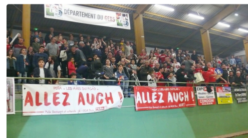
Les supporters auscitains.