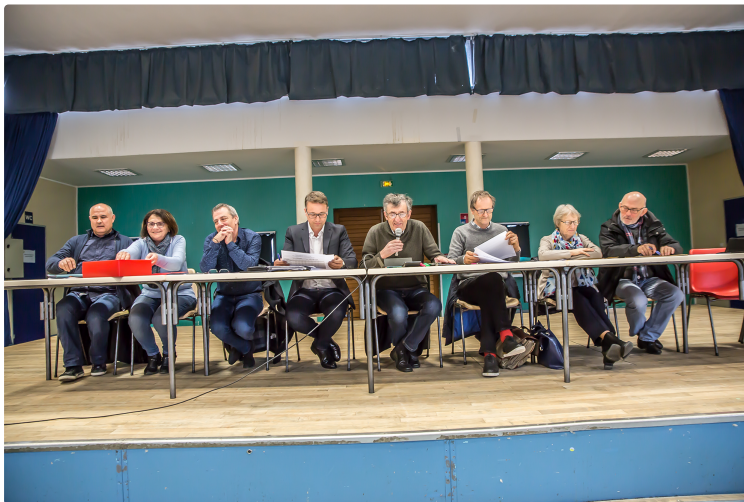
Nogaro – La collecte des ordures ménagères sera plus contraignante

La date de démarrage n'est pas encore fixée