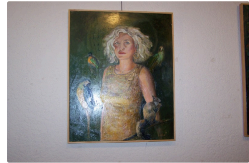
"Portrait of Lady Bird Johnson"