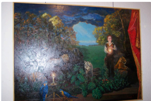
"Boy magicien et ses animaux, derrière le rideau"