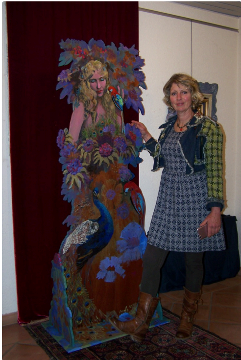
Près de "Lady Godiva" personnage féminin crée en contreplaqué et peinture colorée