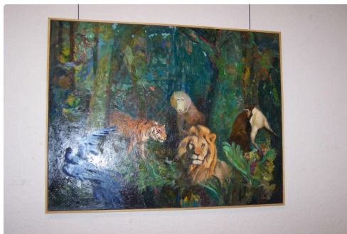
"King of the jungle"