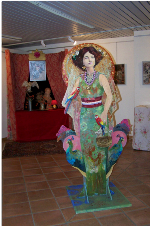
"Dame Victoire et oiseaux"