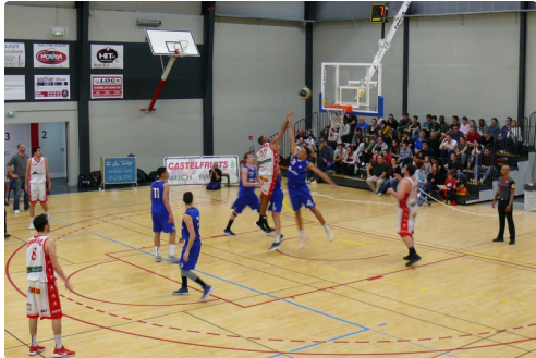
Chaud le rebond.