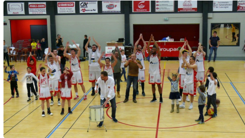
Clapping des joueurs auscitains face aux 500 spectateurs.