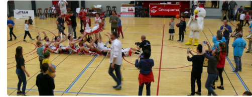
Et un paquito chocolatero pour conclure avec la banda des Grèlés Gascons.