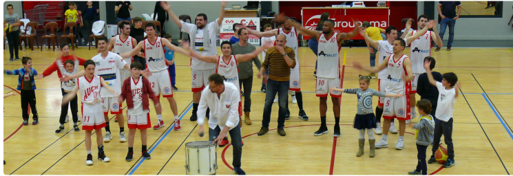
Basket Championnat de France NM3 : Un étourdissant final auscitain