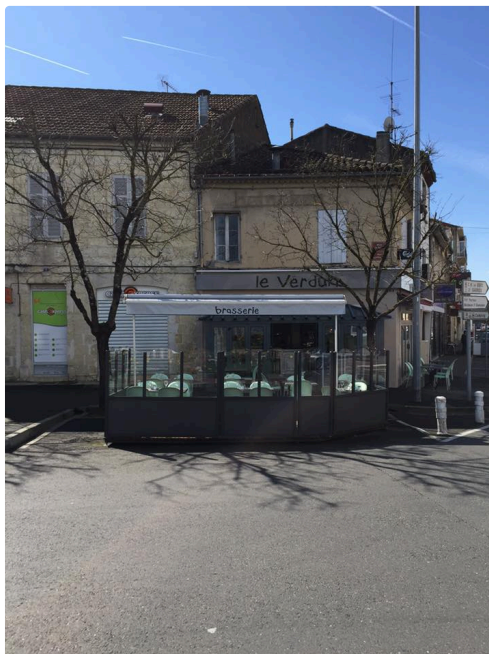
la réunion au café de Verdun.JPG