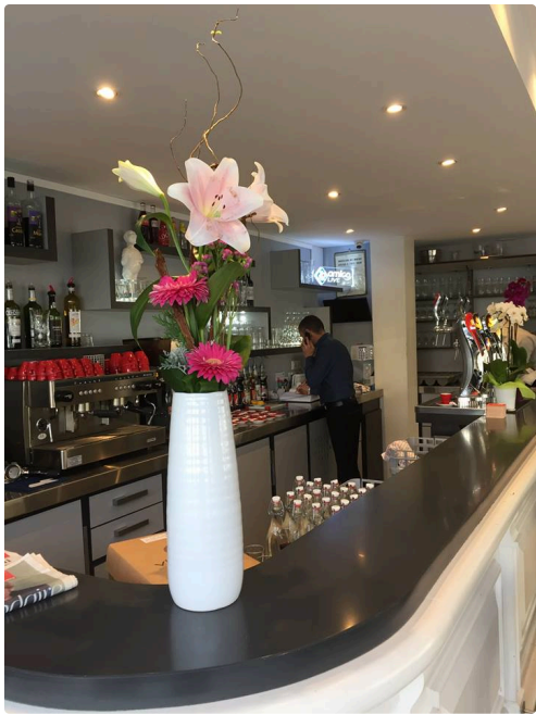
lieu de conférence "café brasserie de Verdun" à Auch, lieu bien accueillant.