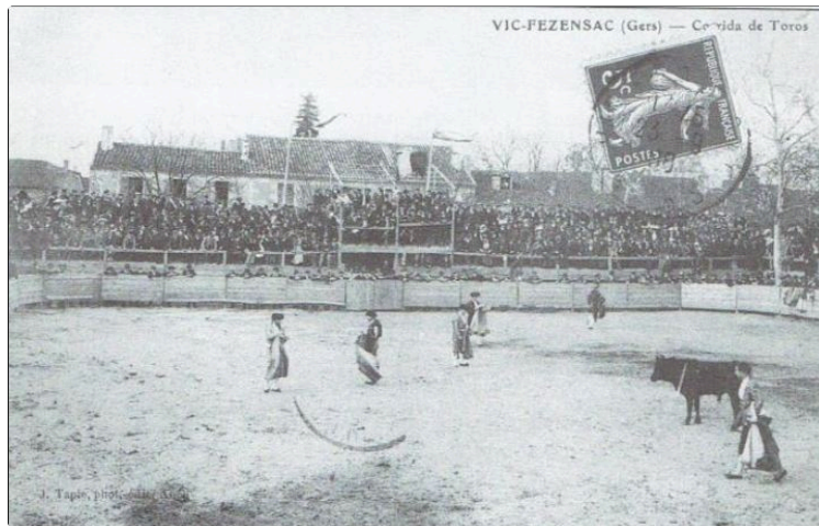
Vic taurin 1851