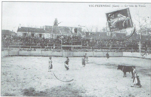
La foule nombreuse occupe les gradins mobiles et les talenquères. Des courses de taureaux ont été organisées au foirail en 1878, 1894, 1904, 1906, 1908...