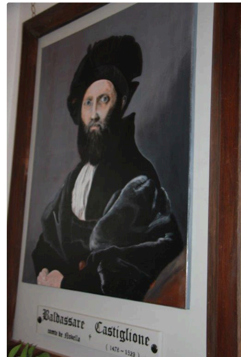
des ancêtres imposants entourant les spectateurs