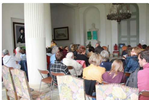
une assistance de 80 personnes