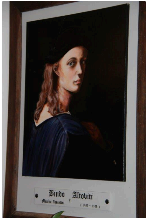
des ancêtres imposant entourant les spectateurs