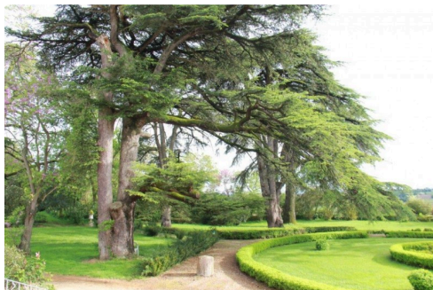
vues des jardins