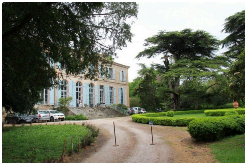
magnifique demeure dans un jardin somptueux