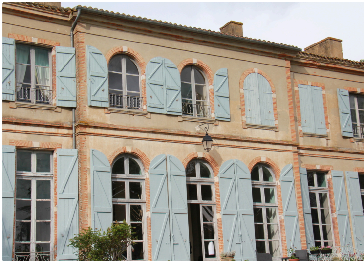
réception au château

Deux spectacles de qualité avec entrée gratuite