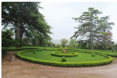
vues des jardins