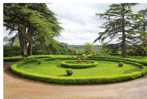
vues des jardins