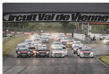
Départ au circuit du Val de Vienne