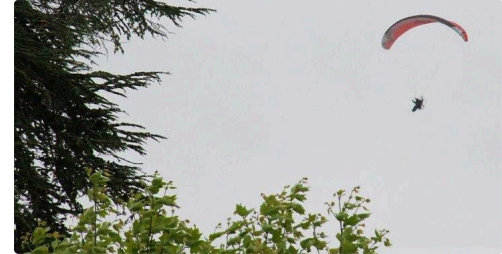
Retour à Condom