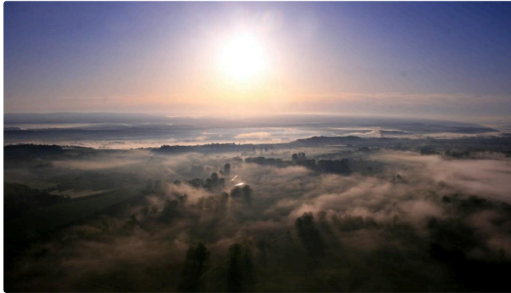
Premier Tour du Sud-Ouest en paramoteur

De drôles d'oiseaux de grande envergure et joyeusement colorés se sont envolés de l'aérodrome du Herret à Condom le samedi 28 avril, lors du départ de la première édition du Tour du Sud-Ouest 2018 en paramoteur.