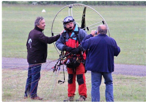
Atterrissage réussi !