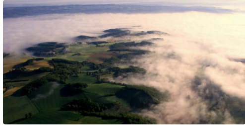
Des images à couper le souffle