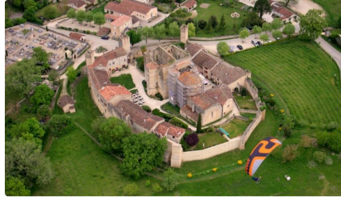
Survol de Larressingle