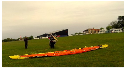
Décollage de l'aérodrome du Herret