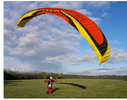
C'est parti !