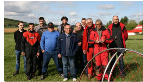
Les participants de ce premier Tour du Sud-Ouest en paramoteur