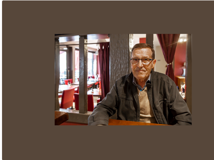
Gascogne sans poids lourds a fait un rêve

Mais elle suit la réalité de près ! Assemblée générale en juin