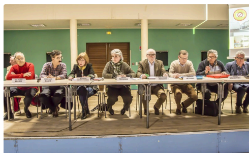
Le bureau de GSPL lors de la réunion publique du 18 mars