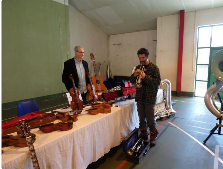
École de musique :

Réussite de la bourse aux instruments de musique et du vide-greniers