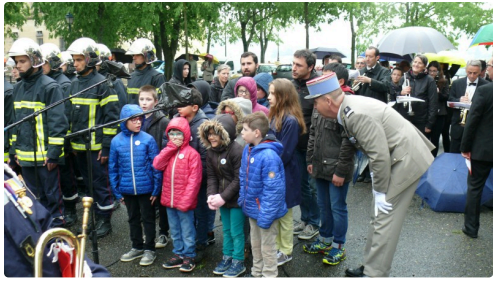
Les enfants du Foyer Louise de Marillac ont chanté la Marseillaise.