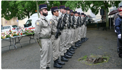
Un contingent de régiment de soutien de Toulouse était présent à la cérémonie.