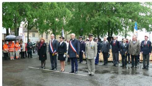
Les officiels au monument aux Morts d'Auch.