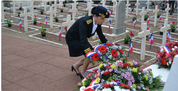
Commémoration du 8 mai : Du carré militaire au monument aux Morts

La commémoration du 73ème anniversaire de la victoire du 8 mai 1945 s'est déroulée sur deux moments forts. Le premier débuta à 9 h 15 par une cérémonie avec dépôt de gerbes au carré militaire du cimetière d'Auch en présence de Catherine Séguin, préfète du Gers, Christian Laprebende, maire d'Auch, Chantal Dejean-Dupebe, Conseillère Départementale et des autorités militaires et de gendarmerie.