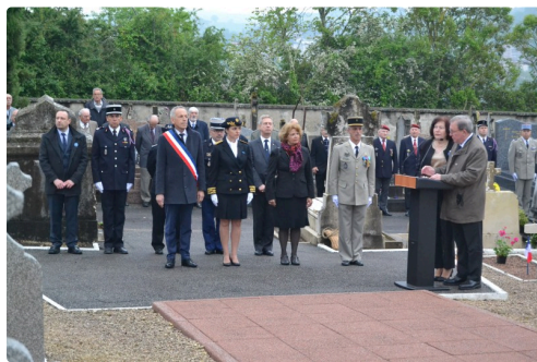
Les officiels au carré militaire d'Auch.

La cérémonie se conclura par la Marseillaise chantée sans doute pas avec toute la solennité voulue par de jeunes enfants du Foyer Louise de Marillac et reprise par la musique des sapeurs pompiers d'Auch tandis que l'ensemble orchestral d'Auch clôturait par le « Chant des partisans ».