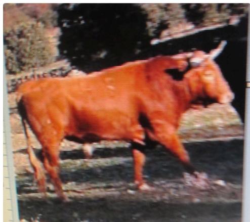
novillo de Retamar

Pierre Dupouy ( les 3 corridas suivantes demain dans un nouvel article)