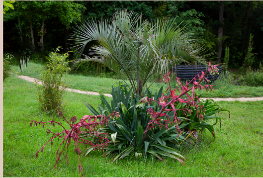
La Palmeraie de Bétous se met sur son 31