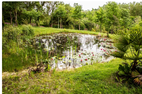
Une des 4 pièces d'eau à lotus et nénuphars