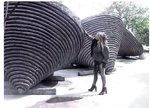
Les vasques des Botta