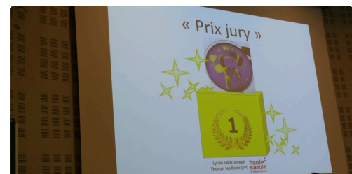
Premier prix du jury.