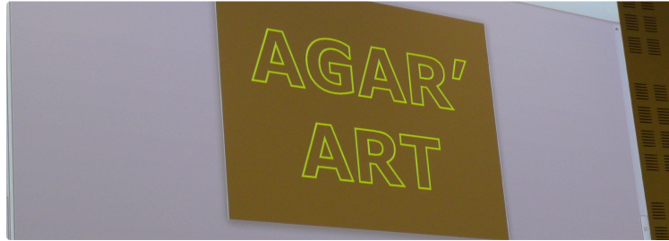
La science et le ludique

L'art de combiner l'imagination artistique et les compétences scientifiques