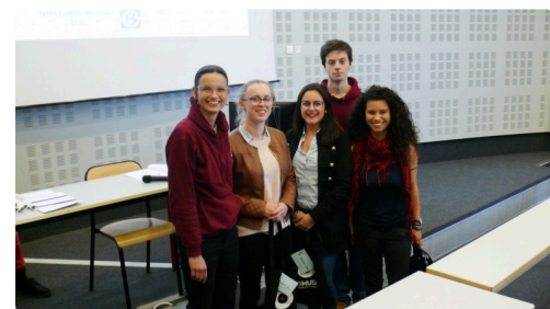
Les lycéens de la Martinière de Lyon ont obtenu le 2ème prix post-bac avec "la gélose Etoile de la mort".