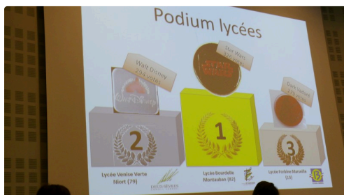
Le podium pré-bac.