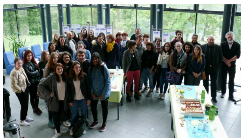
Les étudiants et les professeurs avant la remise des prix.

Prix du jury Lycée Saint-Joseph de Thonon les Bains (Haute Savoie).