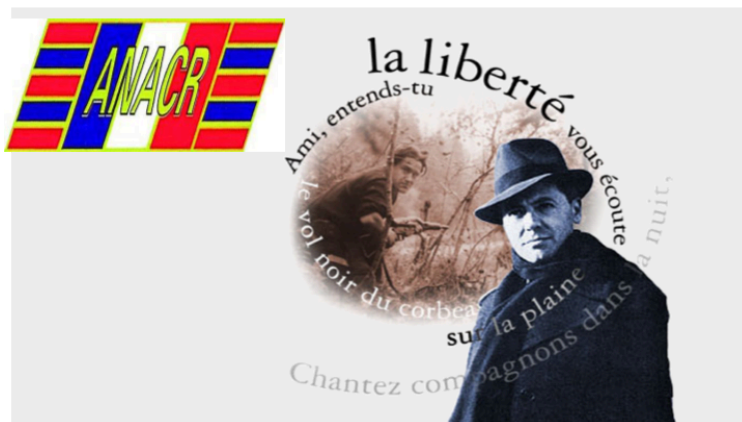
ANACR 32 : journée de la résistance

La Journée nationale de la Résistance ( date officielle, le 27 mai) est l'occasion d'une réflexion sur les valeurs de la Résistance et celles portées par le programme du Conseil national de la Résistance, comme :