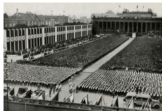
Cérémonie d'ouverture des jeux de Berlin à la gloire du nazisme.

Alors qu'elles comptaient 100 000 membres en 1932, les Jeunesses hitlériennes rassemblent 8,7 millions d'adolescents et de jeunes adultes au début de 1939, soit près de 95 % des garçons allemands. En uniformes – chemises brunes, culottes noires –, les Hitlerjugend apprennent la discipline, font beaucoup de sport et subissent l'endoctrinement de leurs moniteurs. L'hygiène corporelle et le sens du sacrifice occupent une place prépondérante dans cette idéologie. Le premier des « dix commandements de la santé » qu'ils doivent respecter est rédigé ainsi : « Ton corps appartient à la nation, ton devoir est de veiller sur toi-même. » Défilés au pas, parfois avec des armes, pratique du vol en planeur, de la motocyclette, du tir... Aucun de ces jeunes ne se rendit compte que tout cela était une préparation à la vie militaire.