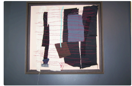
expo mimulus à la galerie nou'Arts 004.JPG