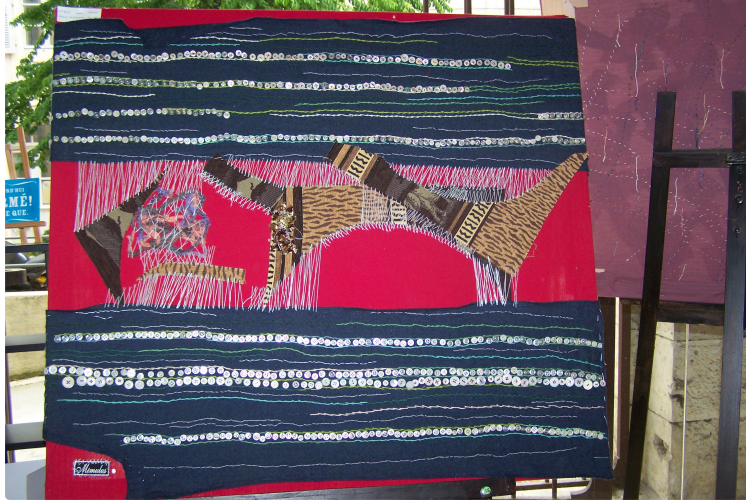
Mimulus "Les yeux nuages" : une artiste hors du commun à nou'Arts Galerie