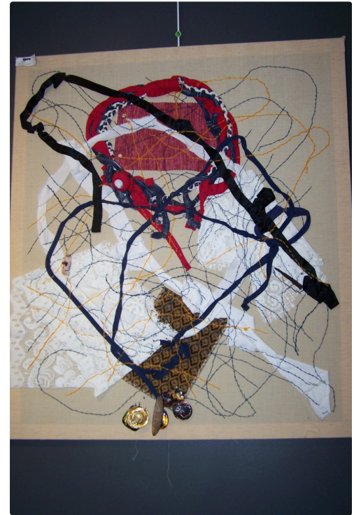
expo mimulus à la galerie nou'Arts 008.JPG