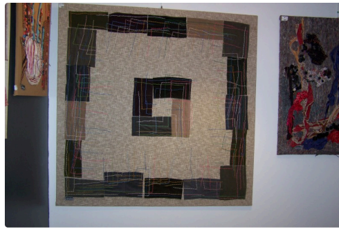
expo mimulus à la galerie nou'Arts 003.JPG