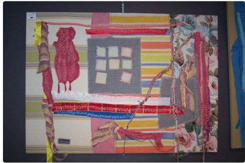
expo mimulus à la galerie nou'Arts 006.JPG