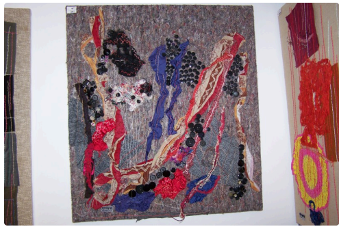
expo mimulus à la galerie nou'Arts 002.JPG